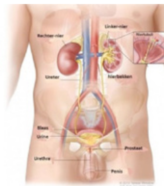
Figuur 2: Urinewegen man